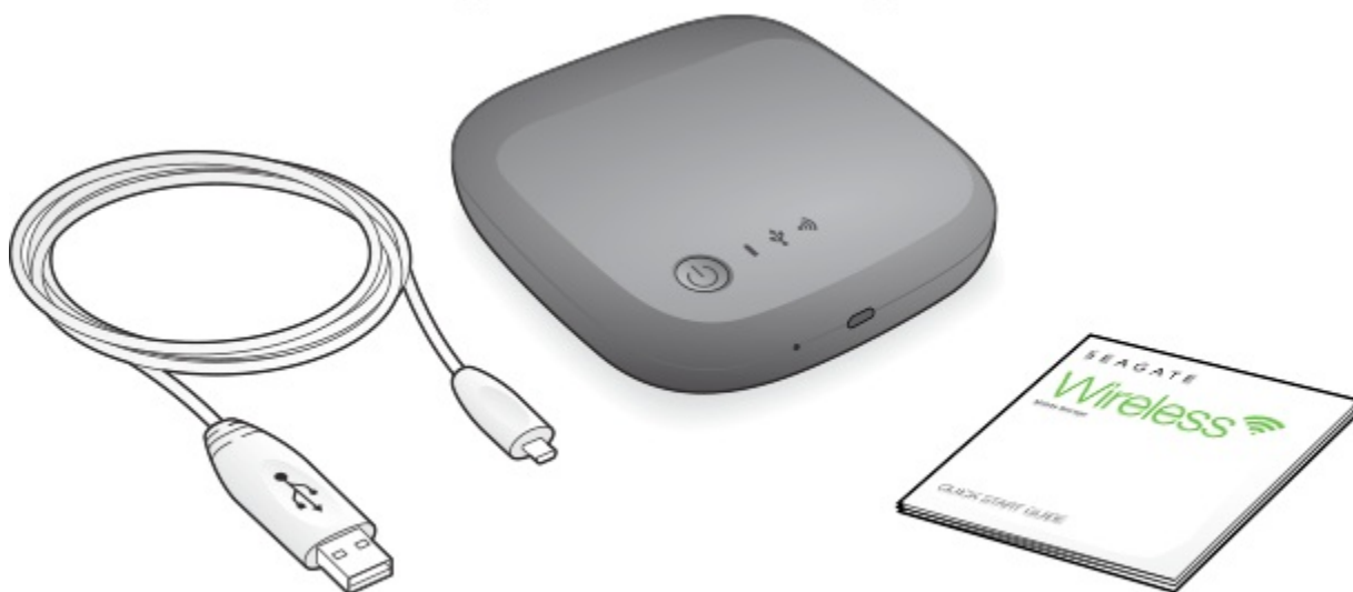
Detachable USB 2.0 Cable